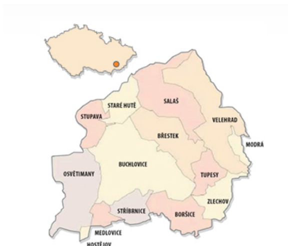
Obrázek 1 Území působnosti MIKROREGION BUCHLOV s vyznačením hranic obcí